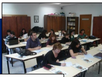
Los alumnos de la UAM.