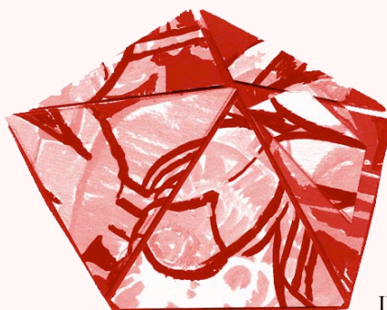
Ilustración de Dinah Salama

LEOPOLDO DE LUIS Poesía cada día , p. 202