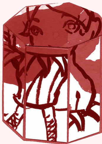
Ilustración de Dinah Salama

AGUSTÍN DE FOXÁ Poesía cada día , p. 178