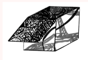
Ilustración de DINAH SALAMA

Las altas horas de estudiante solo y el libro intempestivo junto al balcón abierto de par en par (la calle recién regada desaparecía abajo, entre el follaje iluminado), sin un alma que llevar a la boca.