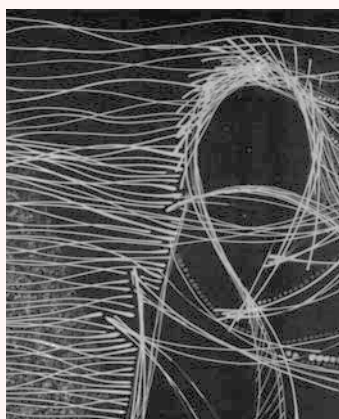
Ilustración de ALVARO LA ROSA

Agradecemos cualquier sugerencia sobre este boletín. Si no desea recibirlo, envíenos, por favor, un correo con "Asunto: No Boletín". Muchas gracias.