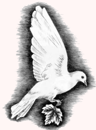
Ilustración de CELSO DOURADO

ROSALÍA DE CASTRO Rosalía de Castro para niños , p. 100