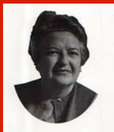
Carmen Conde (1907 - 1996)