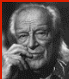
Rafael Alberti (1902 - 1999)